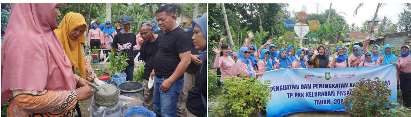
Tabel 3.8 Realisasi Pelaksanaan Program Bidang Pelaksanaan Pembangunan

Peningkatan kapasitas dan pembinaan terhadap warga selaku pengelola agrowisata dilakukan agar lebih siap dalam memberikan service excellent terhadap tamu.