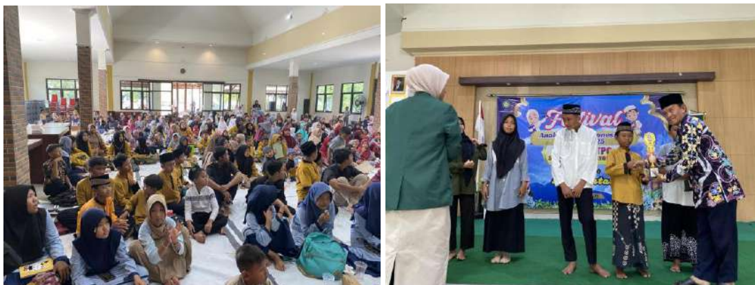
Penyelenggaraan FASI tahun 2025

Festival Anak Sholeh Indonesia (FASI) tingkat Kalurahan Mulyodadi terselenggara tanggal 27 Juli 2025.