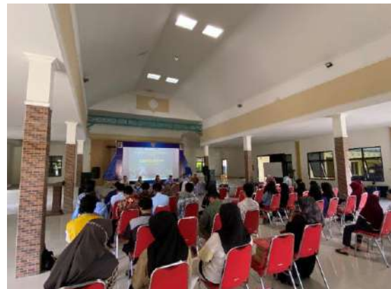
Lomba Menulis Cerita Rakyat