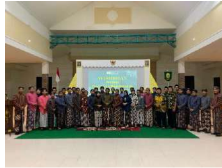
Pawiyatan Panatacara & Pamedharsabda Angkatan 2 Tahun 2025