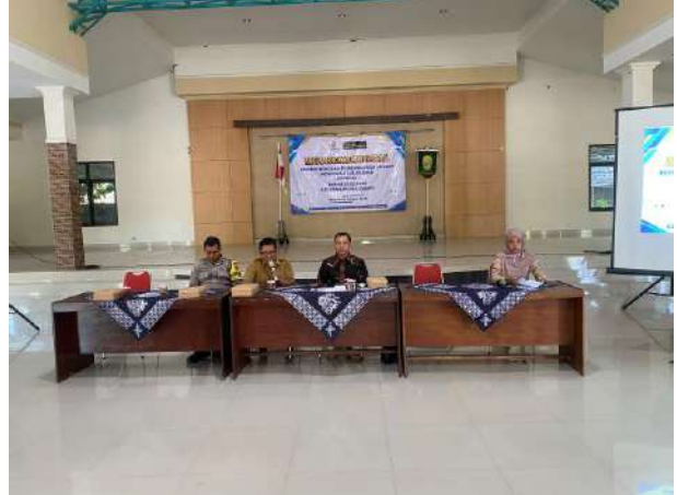
Musrenbangkal RPJMKal TA 2022-2030