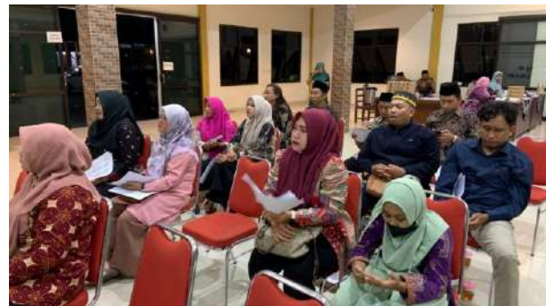
Musyawarah Kalurahan Penetapan RPJMKal TA 2022-2030