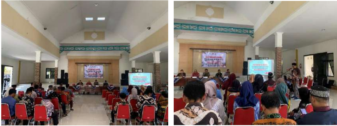
Musyawahar Kalurahan RKPkal TA 2026