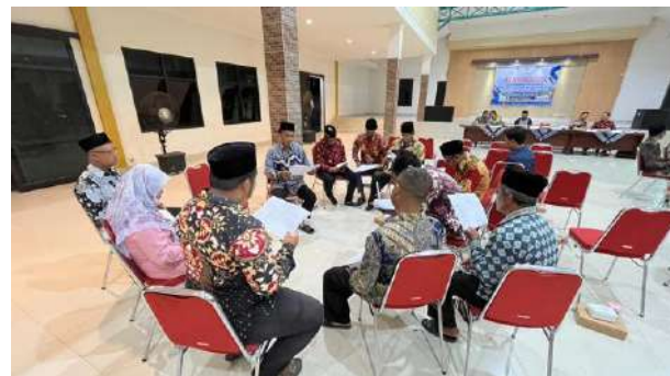
Musrenbangkal RKPKal TA 2026