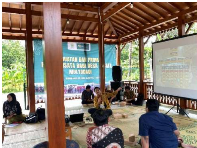
Tabel 3.7 Realisasi Pelaksanaan Program Bidang Pelaksanaan Pembangunan