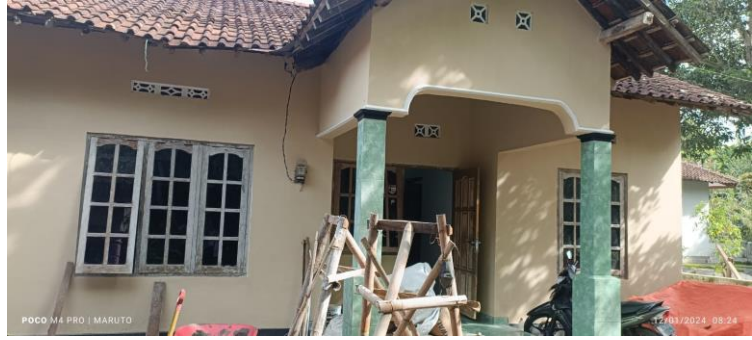
Sebelum dan sesudah Rehab RTLH